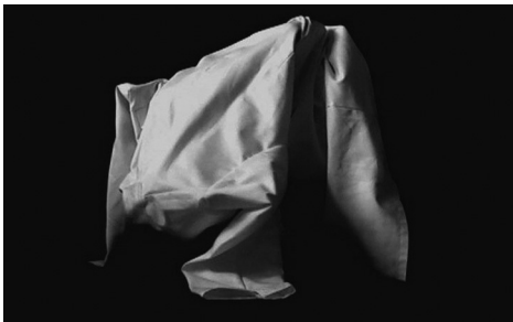
Afbeelding 2. Beeld uit serie 'Hybrids' (2008).

Ondanks deze complexe ethische vragen, of misschien wel dankzij, ben ik overtuigd van de urgentie de discussie over de (bio)medische thema's te stimuleren. Hieraan kunnen kunstenaars een belangrijke bijdrage leveren: als bruggebouwers kunnen ze op verschillende manieren tussen de wetenschap en het publiek opereren, en zo de klinische en persoonlijke 'landschappen' ineen laten strengen.