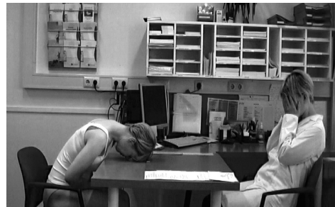
Afbeelding 1. Second opinion (2008).

Het is geen toeval dat de camera en mijn lichaam mijn belangrijkste 'onderzoeksinstrumenten' zijn: gezien mijn opleiding zijn ze voor mij de logische instrumenten om de wereld om me heen te verkennen. Bovendien staan het lichaam en camera ook centraal in de medische wereld. De echtheid van video fascineert me, in combinatie met de mooie 'leugens' die de camera kan creëren binnen een totaal